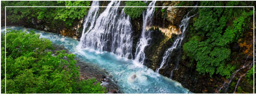
SHIRAHIGE WATERFALL น้ำตกชิราฮิเกะ

วันที่สอง ทำอากาศยานนิวซีโดเสะ สอกไกโด – เมืองบิเอะ – น้ำตกชิราฮิเกะ – สระอะโออิเคะ หรือ บ่อน้ำสีฟ้า – เมืองอาซาฮิดาวา – อีออน อาซาฮิดาวา