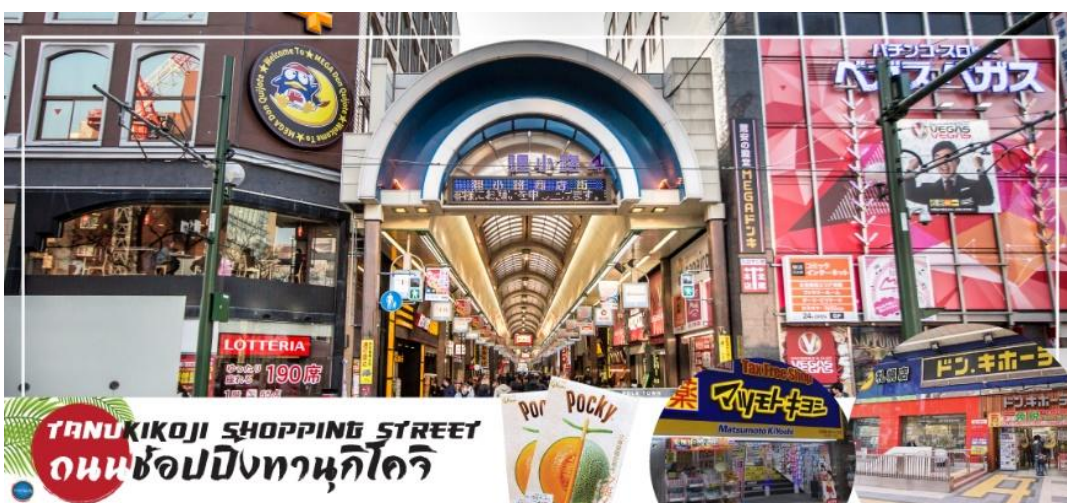
TANUKIKOJI SHOPPING STREET ถนนช้อปปิ้งทานุกิโคจิ