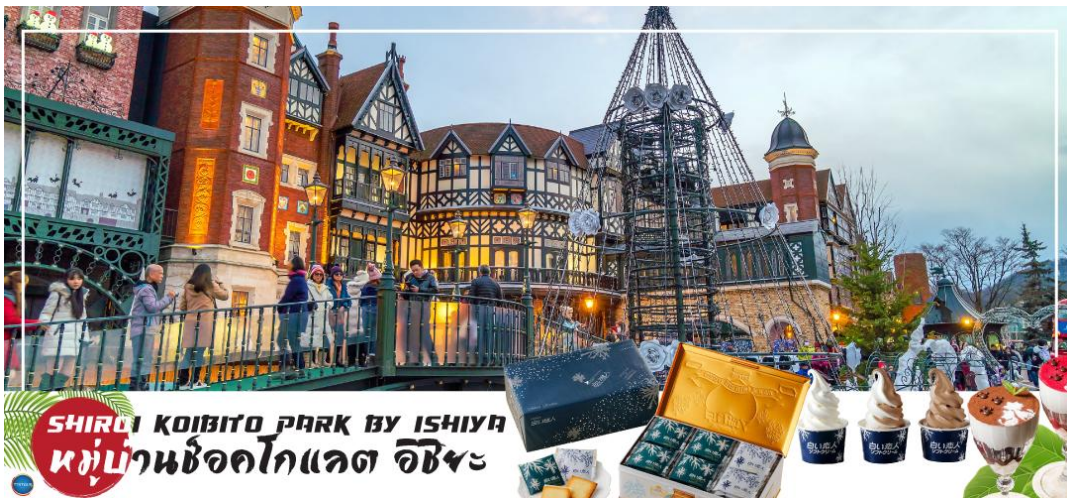
SHIROI KOIBITO PARK BY ISHIYU หมู่บ้านช็อคโกแลต อิชิยะ

โกแลตที่ขึ้นชื่อที่สุดของที่นี่คือ Shiroi Koibito ซึ่งมีความหมายว่าช็อคโกแลตชาวแต่งงานรัก ท่านสามารถเลือกซื้อกลับไปให้คนที่ท่านรักทานหรือว่าซื้อเป็นของฝากติดไม้ติดมือกลับบ้านก็ได้ นอกจากนี้ท่านจะได้เลือกซื้อช็อคโกแลตที่หลากหลายที่หาซื้อที่ไหนไม่ได้ และ ท่านก็ยังจะได้ชมประวัติความเป็นมาของโรงงาน และการผลิตช็อคโกแลตอีกด้วย